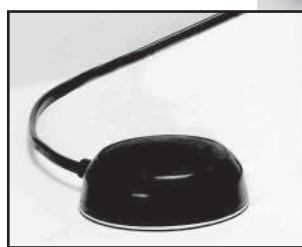
丸型フットスイッチ(別売) 踏んでいる間ON