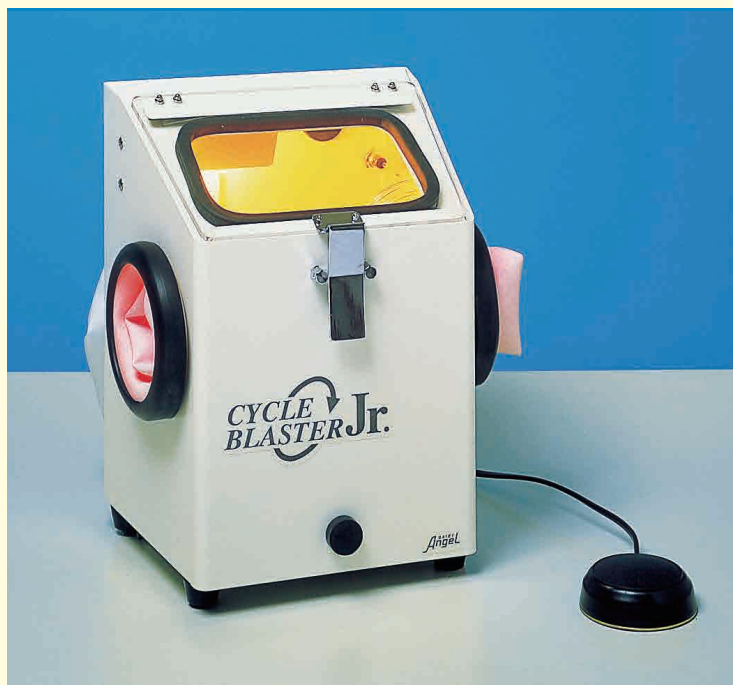
ノズルを固定して使用