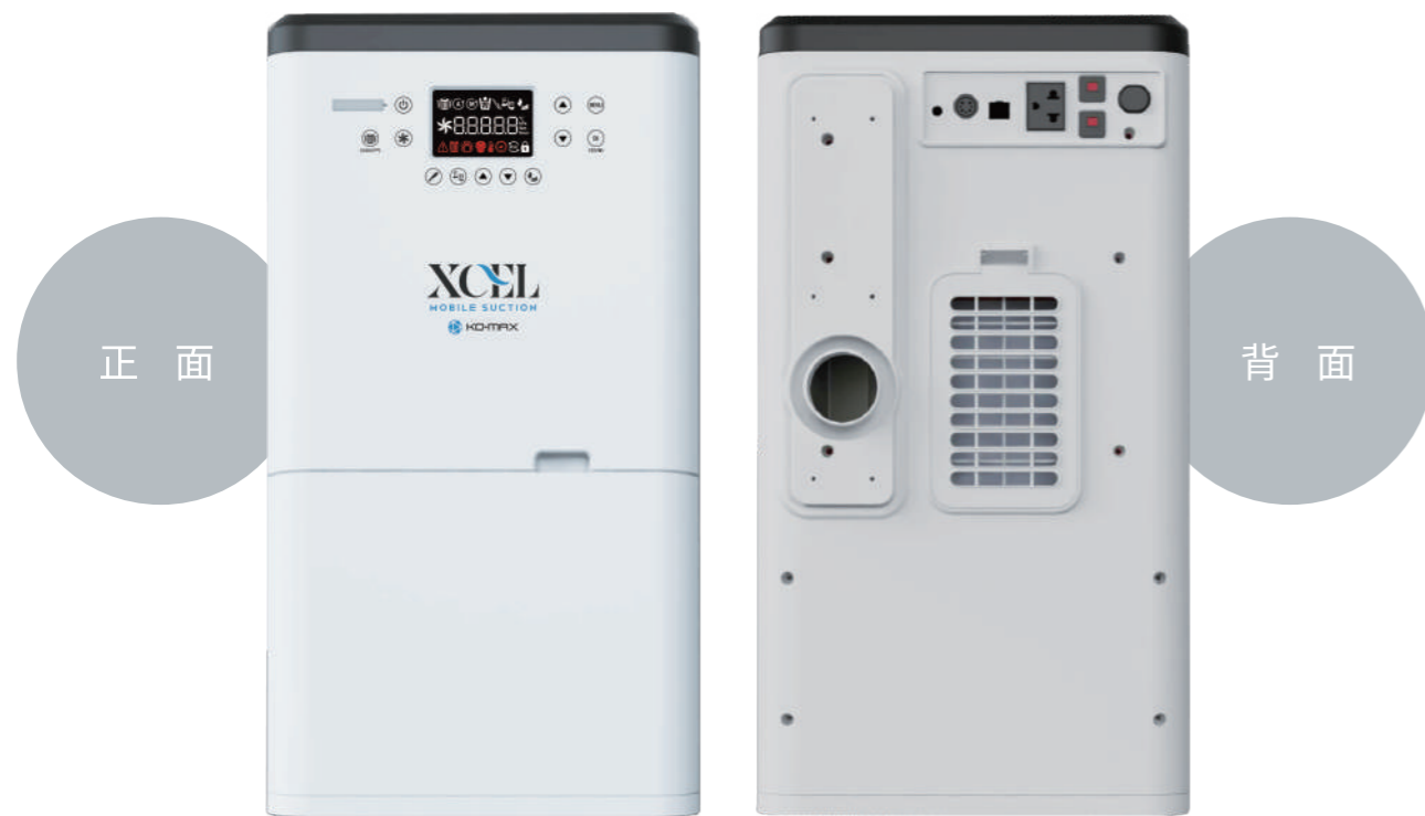
商品名 XCEL 標準価格 350,000円(税別)